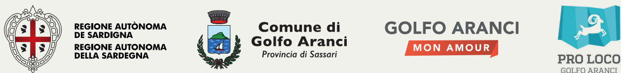
Esempio di gerarchia dei loghi